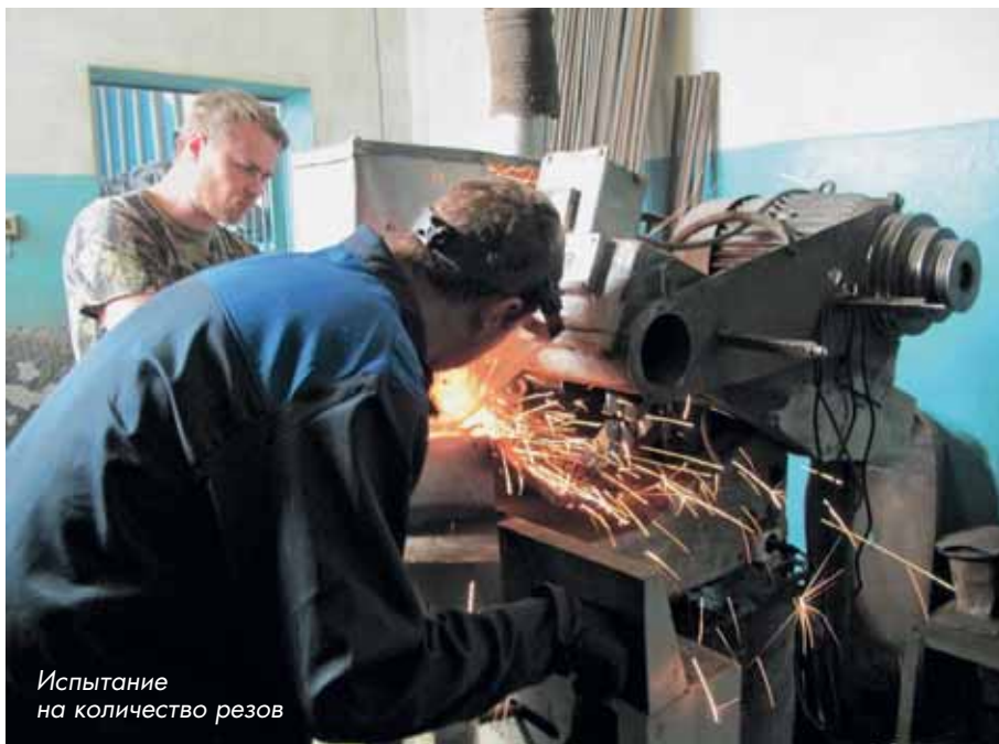
Испытание на количество резов

В отдельную таблицу вынесены результаты испытаний кругов, которые предположительно являются подделкой под продукцию «Лужского абразивного завода». Во всяком случае, такой версии придерживаются представители этой компании, оснований сомневаться в этом у нас нет.