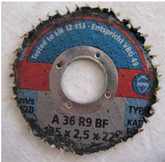
Примерно так выглядел круг толщиной 2,5 мм после попыток резать арматурный прут. Видны следы сильного бокового трения, да и режущая кромка явно в ненормальном состоянии — перегрета и обломана по кругу

начинает закусывать, потому что боковое трение в данном случае гораздо выше, чем при ручной резке. Примерно так же закусывает плохо разведенное полотно ножовки в узком пропилах. Свою лепту вносит электроника — как только круг закусывает, возрастает температура обмотки и срабатывает электроника, ограничивающая ток. При этом резко падает мощность, и дальше уже приходится выводить диск из пропила и гонять УШМ на холостых оборотах, чтобы охладить. Но это не дает догворременного эффекта.