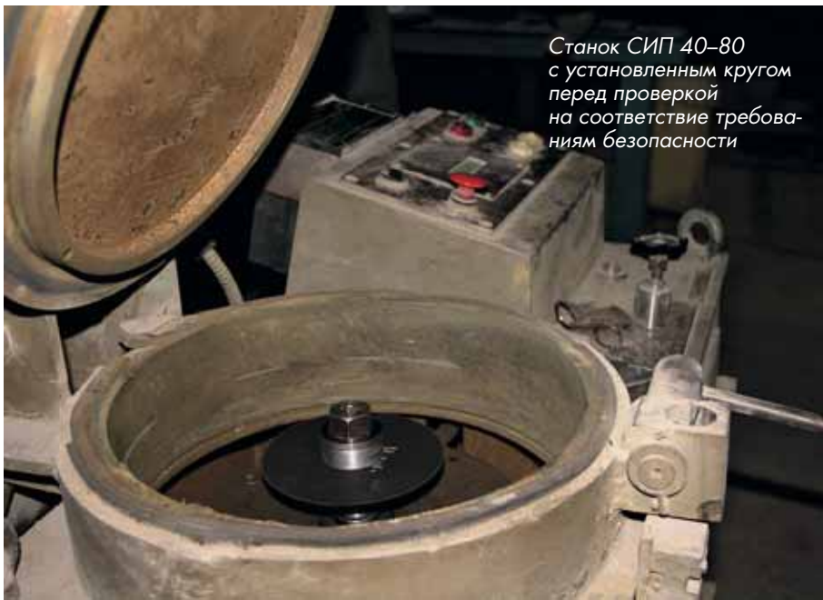
Станок СИП 40–80 с установленным кругом перед проверкой на соответствие требованиям безопасности

У этих кругов есть несколько внешних отличий: у них отслаивается армирующая сетка по краю, и это хорошо заметно на фотографии, они имеют специфический резкий запах... но самое печальное, что при испытаниях на безопасность образец из этой партии разлетелся сразу же, как только включили станок — уже на 500 об/мин. Можно не сомневаться, что он точно так же повел бы себя и при установке на УШМ, ведь ее рабочая скорость намного превышает эти несчастные полтысячи оборотов.