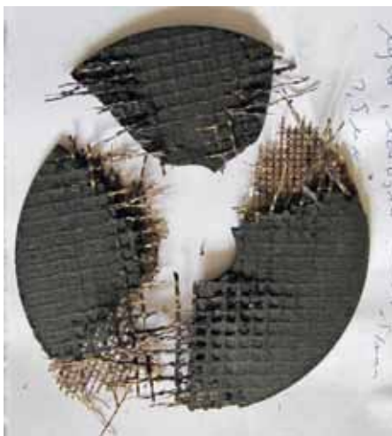
Вот на такие фрагменты может разлететься отрезной круг

У этих кругов есть несколько внешних отличий: у них отслаивается армирующая сетка по краю, и это хорошо заметно на фотографии, они имеют специфический резкий запах... но самое печальное, что при испытаниях на безопасность образец из этой партии разлетелся сразу же, как только включили станок — уже на 500 об/мин. Можно не сомневаться, что он точно так же повел бы себя и при установке на УШМ, ведь ее рабочая скорость намного превышает эти несчастные полтысячи оборотов.