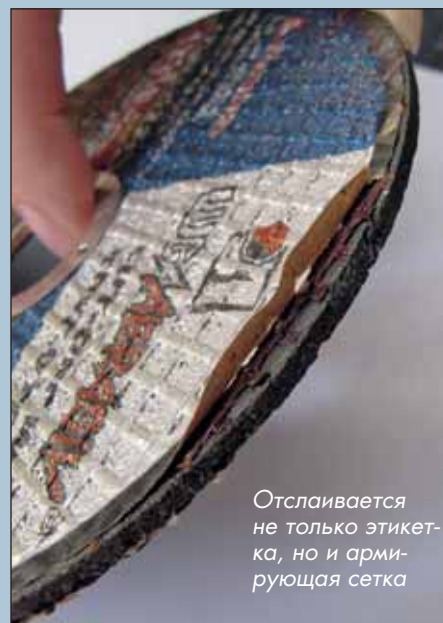
Отслаивается не только этикетка, но и армирующая сетка

Ну а теперь — о результатах испытаний этих кругов. Нарезали очень мало (что самое удивительное — больше всего нарезали именно тот круг, что на фото с отслаивающейся сеткой, он выглядел хуже остальных). Но это еще полбеды — проверка на безопасность провалялась с тре-