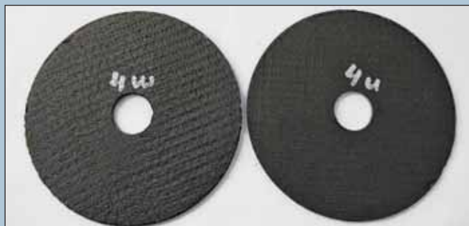
Слева — предположительная подделка, справа — образец, в происхождении которого мы уверены. Видно, что у левого образца армирование «какое-то не такое»... при внимательном исследовании становится понятно, что с этой стороны в нем не одна сетка, как должно быть, а сразу три

Наконец, есть еще один факт, который заставил нас сразу же усомниться в происхождении образцов. Но его не передать с помощью фотографии — это резкий неприятный запах (будто кот пометил). Вариант с диверсией со стороны домашних животных полностью исключен, в качестве возможной причины специалисты назвали нам использование казеинового или другого подобного клея вместо синтетического. То есть рецептура здесь слишком уж своеобразная. Представители «Лужского абразивного завода» уверены, что в данном случае мы столкнулись именно с подделкой.